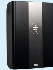
KAWAmax & KAWAmidi